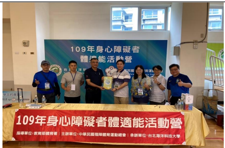
109 年身心障礙體適能活動營