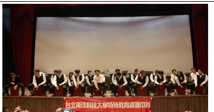
海樂聖誕狂想音樂會活動