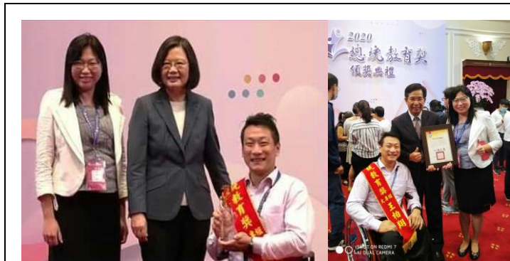
本校特教生學榮獲 2020 總統教育獎