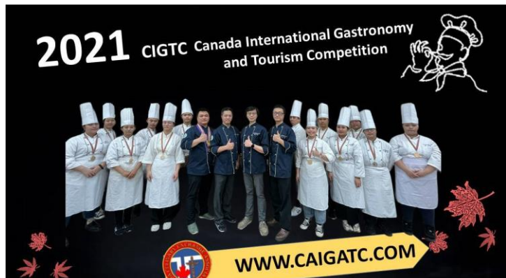
參加 2021 CIGTC 加拿大國際餐飲大賽