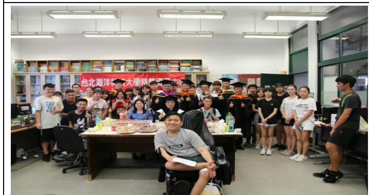
特教畢業生溫馨聚餐