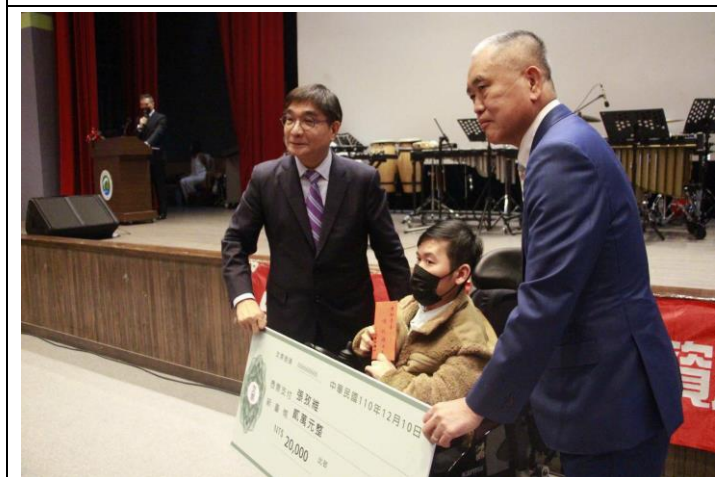
校長頒發特教生獎學金