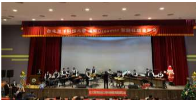
海樂聖誕狂想音樂會活動