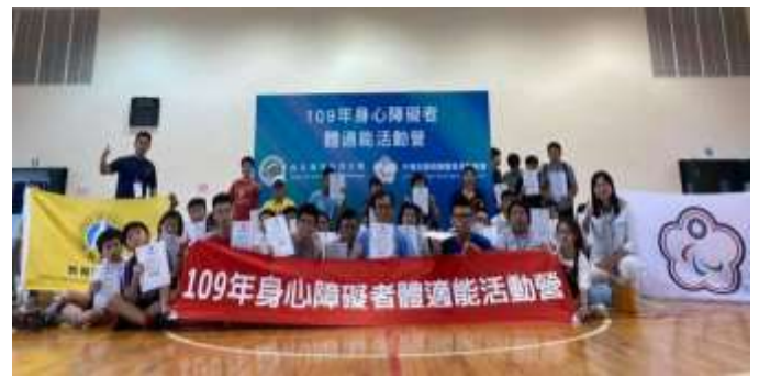
109 年身心障礙體適能活動營