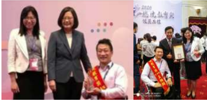
本校特教生學榮獲 2020 總統教育獎