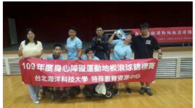
參加全國身心障礙運動地板滾球錦標賽