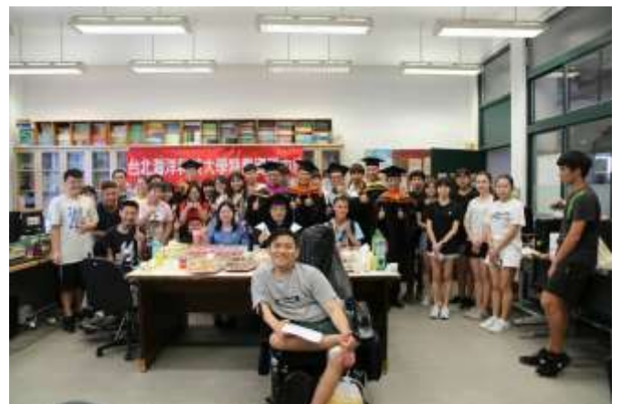
特教畢業生溫馨聚餐