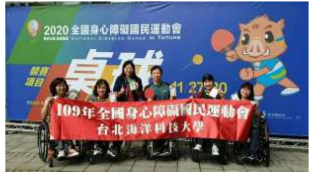
109 年全障運榮獲 1 金 3 銀 5 銅佳績