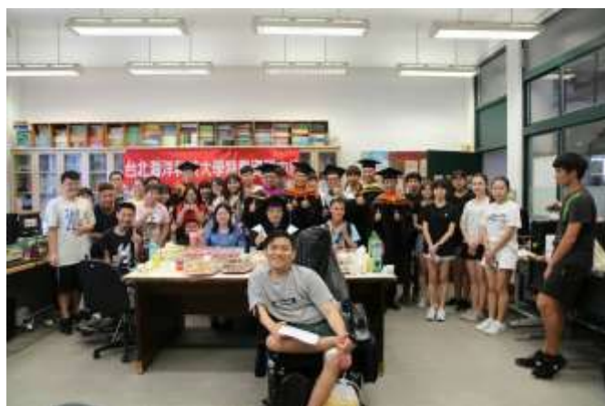
特教畢業生溫馨聚餐