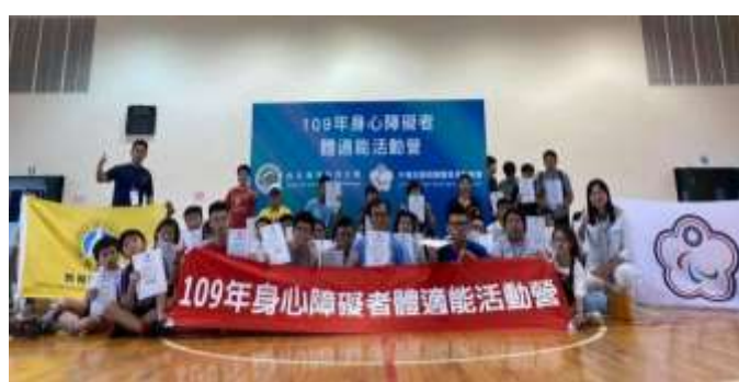
109 年身心障礙體適能活動營