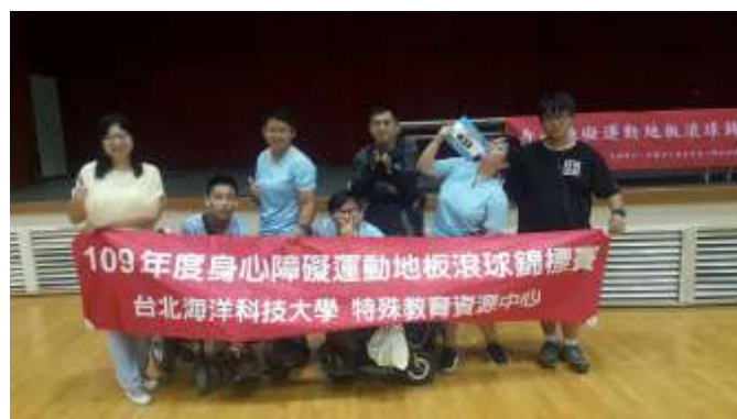
參加全國身心障礙運動地板滾球錦標賽