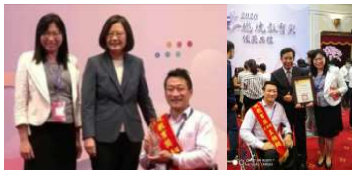
本校特教生學榮獲 2020 總統教育獎