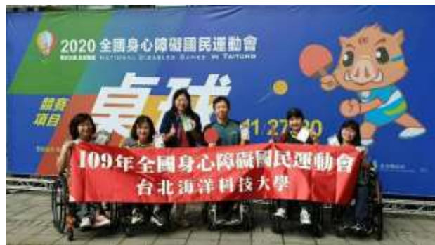
109 年全障運榮獲 1 金 3 銀 5 銅佳績