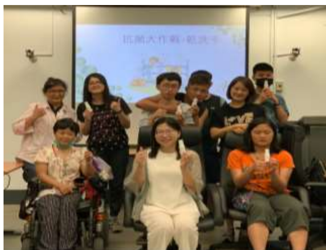
幸福芳療室-精油乾洗手 課程