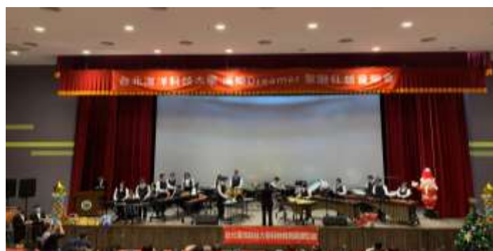
海樂聖誕狂想音樂會活動