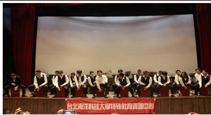
聖誕感恩音樂會活動