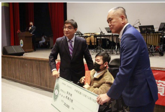
校長頒發特教生獎學金