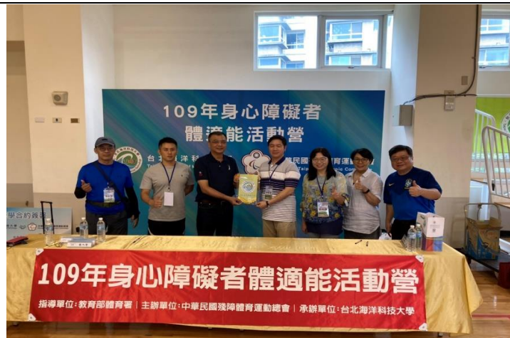
109 年身心障礙體適能活動營