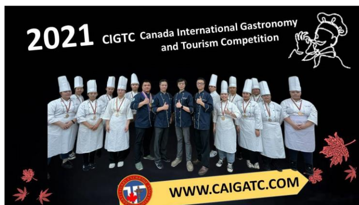
參加 2021 CIGTC 加拿大國際餐飲大賽