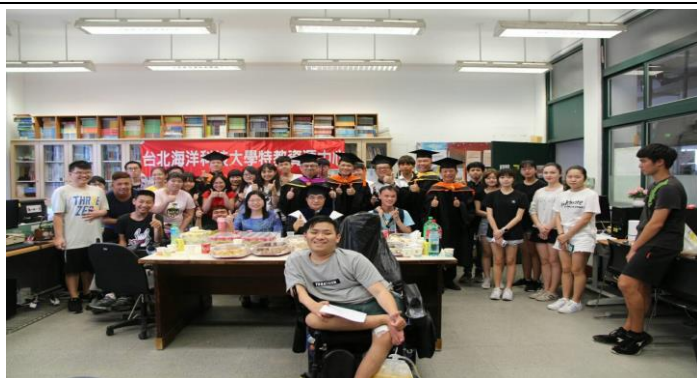
特教畢業生溫馨聚餐