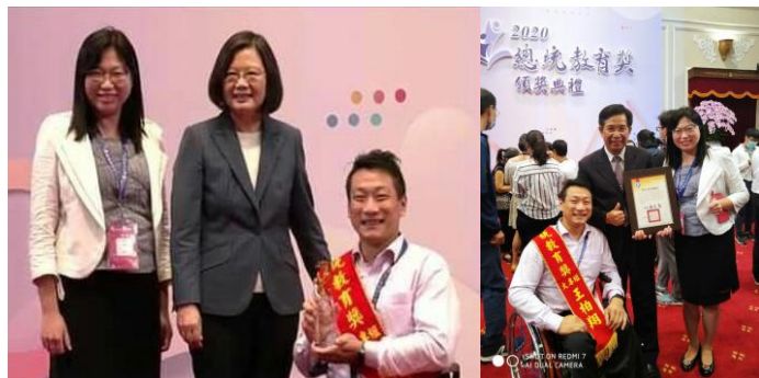
本校特教生學榮獲 2020 總統教育獎