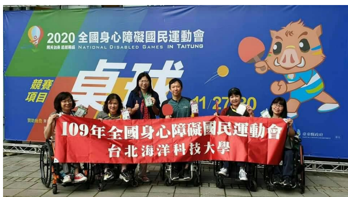
109 年全障運榮獲 1 金 3 銀 5 銅佳績