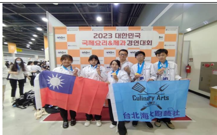
參加 2023 KICC 韓國國際餐飲大賽 1 金 1 銅