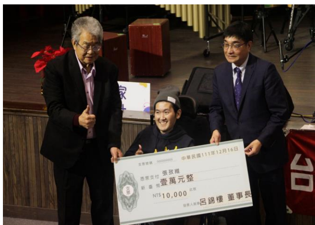
校長頒發特教生獎學金