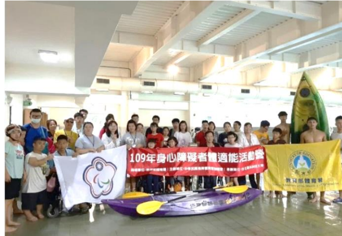
身心障礙體適能活動營