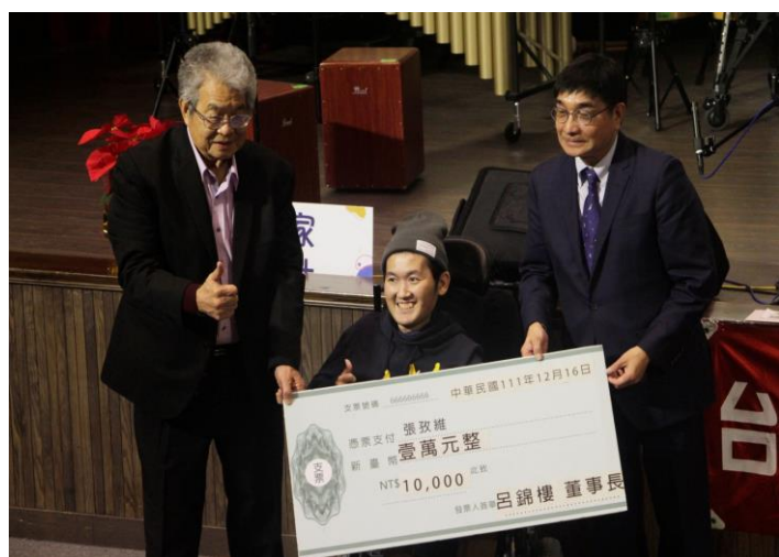
校長頒發特教生獎學金