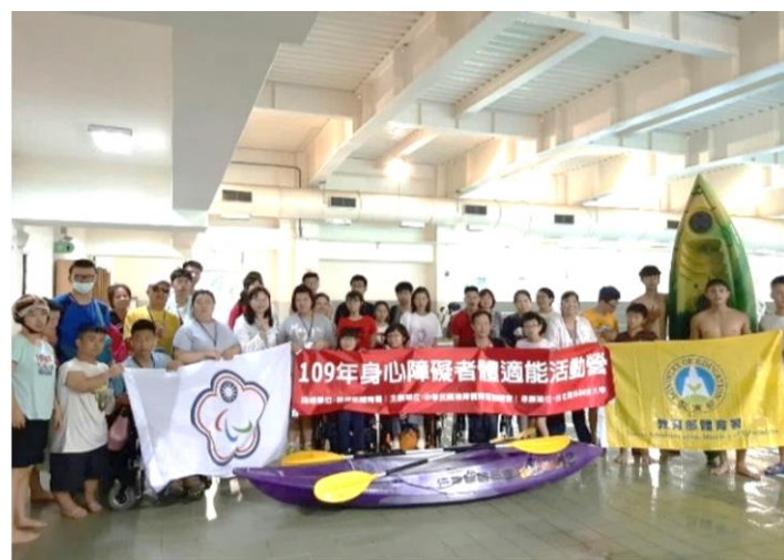
109 年身心障礙體適能活動營