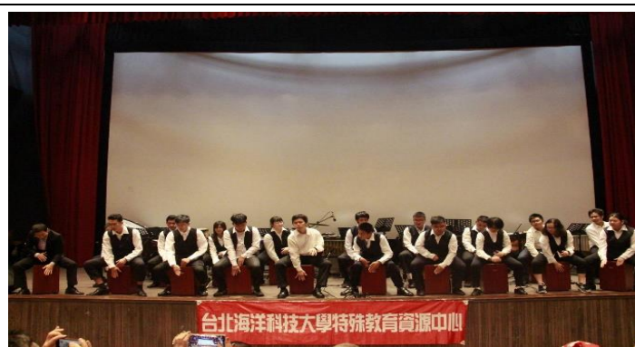
海樂聖誕狂想音樂會活動