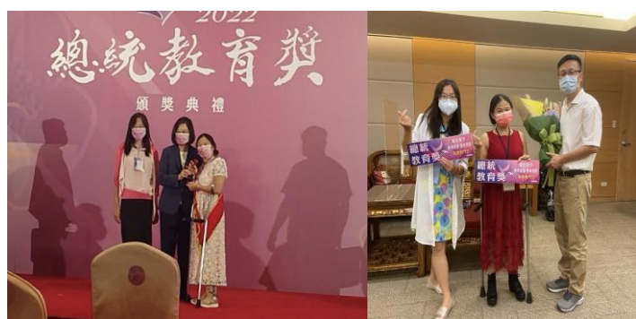
本校特教生學榮獲 2022 總統教育獎