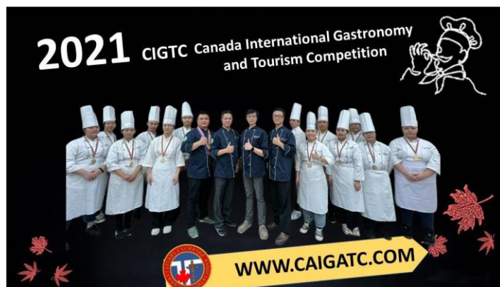
參加 2021 CIGTC 加拿大國際餐飲大賽