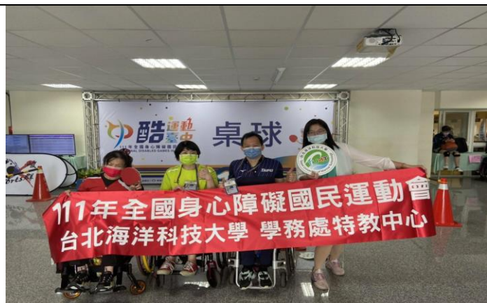
111 年全障運榮獲 2 金 4 銀 1 銅佳績