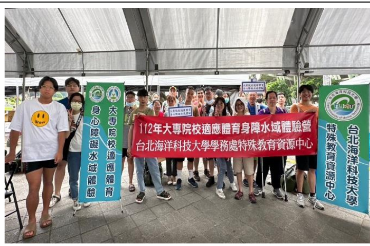
全國大專校院身心障礙適應體育體驗營活動