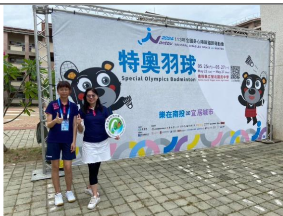
全國身心障礙運動會榮獲 2 金 1 銀 5 銅佳績