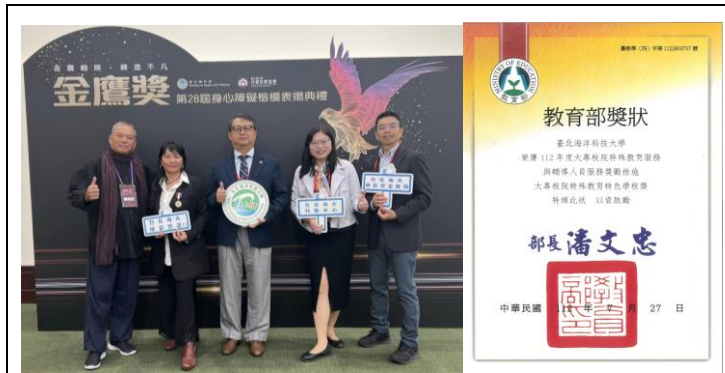
本校特教生榮獲衛福部全國身障楷模金鷹獎 本校榮獲 112 年度大專校院特殊教育特色學校獎