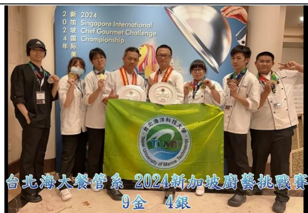
參加 2024 新加坡廚藝挑戰賽 9 金 4 銀