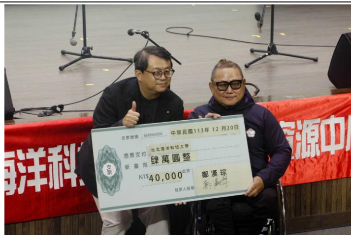
校長頒發輪椅網球帕運國手獎學金